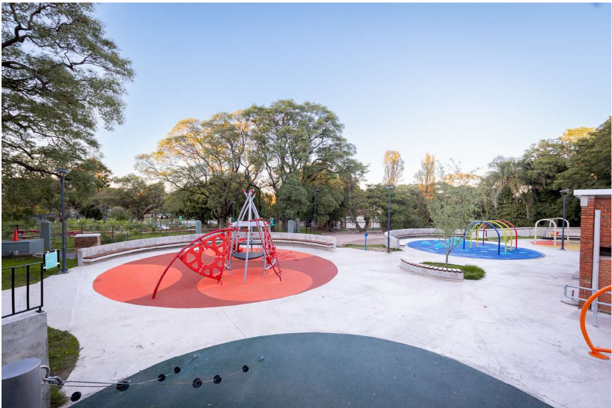
Vista juegos recreativos con chorros de agua en Villa Dolores

Se propone un parque lineal por calle Francisco Acuña de Figueroa desde calle Miguel Barreiro hasta calle J.P. Varela, la idea es proporcionar espacios recreativos para equilibrar y consolidar la zona Este. Se plantean espacios peatonales, un polideportivo con piscina y zonas recreativas. Una piscina pública en la ciudad es fundamental. Al día de hoy no se cuenta con ninguna zona pensada para recrearse en verano, se proyectan juegos recreativos donde el agua sea el factor dominante.